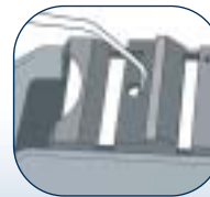
2. Für die Kürettenspitze (Rundung)