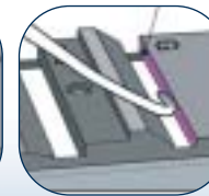
3. Für Gracey Küretten