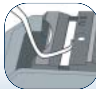
1. Für Universalscaler und Küretten